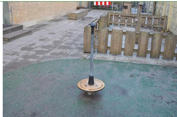
Redskab: Karusel Årgang: 2021 Producent: Kompan Er redskabet mærket: Ja Emne 20: Er der registreret fejl / mangler: Nej