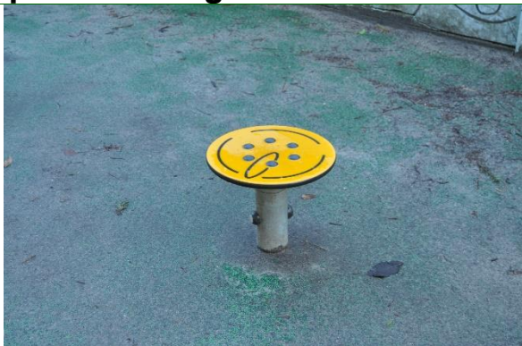
Redskab: Karusel Årgang: 2021 Producent: Kompan Er redskabet mærket: Ja Emne 19: Er der registreret fejl / mangler: Nej