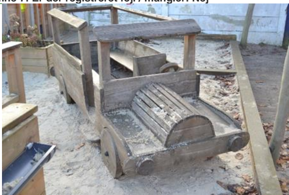
Redskab: Legebil Producent: BOS A/s Er redskabet mærket: Ja Emne 9: Er der registreret fejl / mangler: Nej