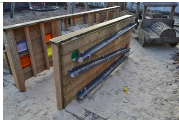
Redskab: Vandleg Producent: NIKOSTINE Er redskabet mærket: Ja Emne 8: Er der registreret fejl / mangler: Nej