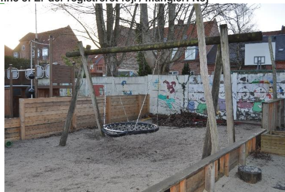
Redskab: Gyng Producent: Er redskabet mærket: Nej Emne 10: Er der registreret fejl / mangler: Ja