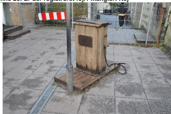
Redskab: Legeredskab Årgang: Producent: Er redskabet mærket: Nej Emne 22: Er der registreret fejl / mangler: Ja