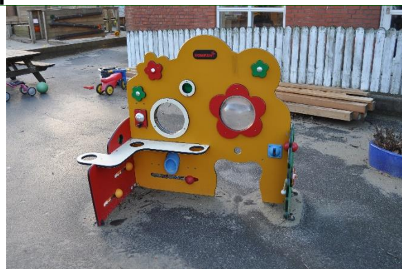
Redskab: Legeredskab Producent: Kompan Er redskabet mærket: Ja Emne 2: Er der registreret fejl / mangler: Ja