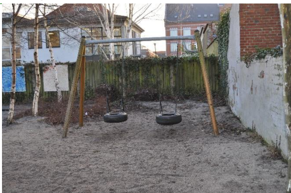
Redskab: Gynger Producent: Er redskabet mærket: Nej Emne 13: Er der registreret fejl / mangler: Ja