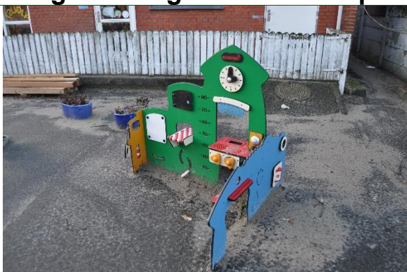
Redskab: Legeredskab Producent: Kompan Er redskabet mærket: Ja Emne 1: Er der registreret fejl / mangler: Nej