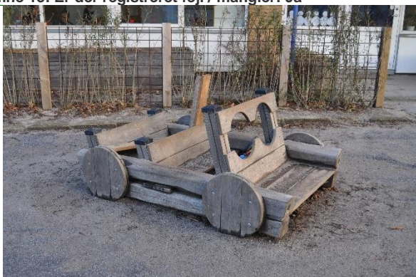
Redskab: Legebil Producent: Guldborg Er redskabet mærket: Ja Emne 15: Er der registreret fejl / mangler: Nej