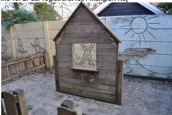
Redskab: Legehus Årgang: Producent: Er redskabet mærket: Nej Emne 21: Er der registreret fejl / mangler: Ja