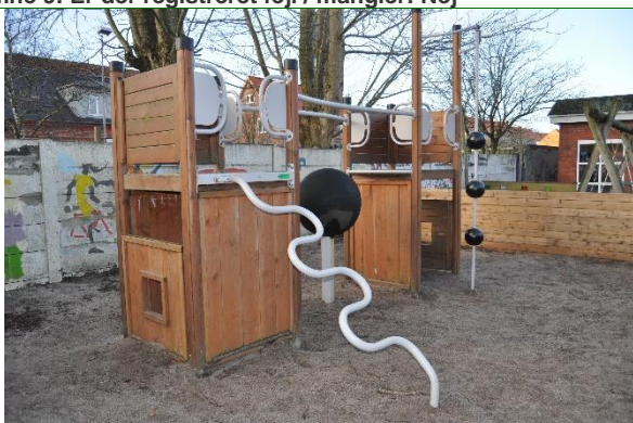
Redskab: Klatretårn Producent: HAGS Er redskabet mærket: Nej Emne 11: Er der registreret fejl / mangler: Nej