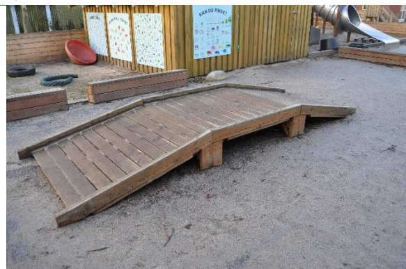
Redskab: Balance bom Producent: InoPlay Er redskabet mærket: Ja Emne 14: Er der registreret fejl / mangler: Nej