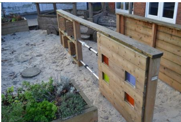
Redskab: Legeredskab Producent: NIKOSTINE Er redskabet mærket: Ja Emne 7: Er der registreret fejl / mangler: Nej